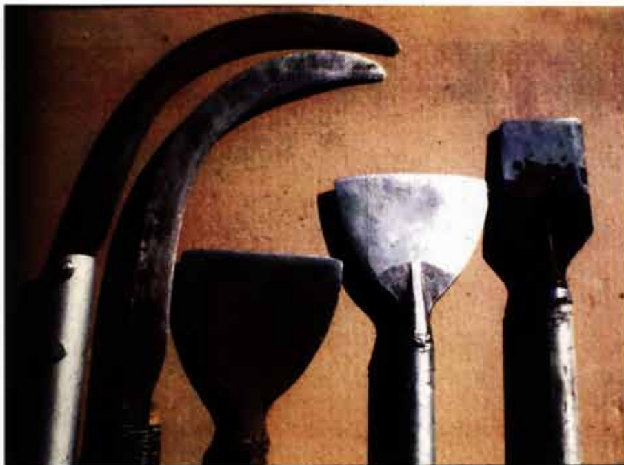
Diferentes tipos y tamaños de cuchillos y chuzas para cortar palma

Para cosechar racimos en palmas jóvenes (menores a 3 años) se usa un cincel o macana de 6-8 cm de ancho acoplado al extremo de una vara de madera o tubo de metal de 1.20 a 1.50 m de longitud, con una agarradera. Estas medidas permiten cortar únicamente el racimo sin dañar las hojas a la vez que el tubo largo evita accidentes por espinadas. Durante la cosecha se eliminan algunas hojas de la palma para facilitar la corta del racimo, aunque debe insistirse que en estas plantas la fruta debe ser "robada", y que no debe herirse el tronco ni hojas vecinas. En palmas jóvenes es frecuente encontrar racimos podridos, (mala polinización, racimos fallados o enfermos) los que deben ser cortados para sanear la planta. El uso del cincel se discontinúa cuando los racimos están a una altura de 1.0/1.5 m sobre el nivel del suelo.