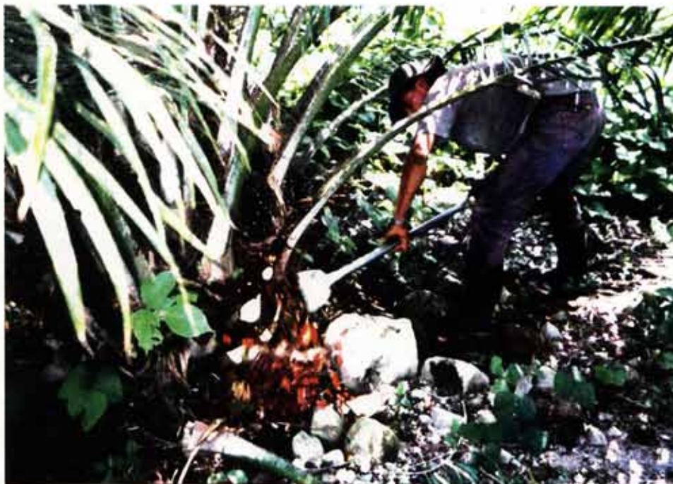
Palmicultor utilizando una chuzá

Después del cincel se usa la chuzá, instrumento con una hoja de 14 cm de ancho y un tubo de 1-3 m de largo, dimensiones que dependerán de la altura de la palma. Las chuzas con tubos o barras largas se usan para cosechar racimos hasta una altura aproximada de 3-4 m. El empleo de chuzas requiere mucho cuidado para no accidentarse por lo que el uso de guantes es muy necesario.